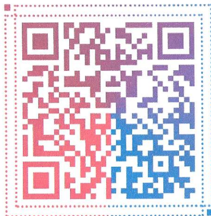
汝州市企业开办“一网通办”操作视频