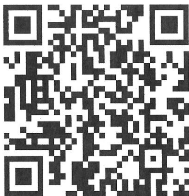
汝州市企业开办“一网通办” 操作手册